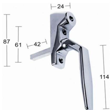
SPANJOLETTHANDTAG MED LÅS